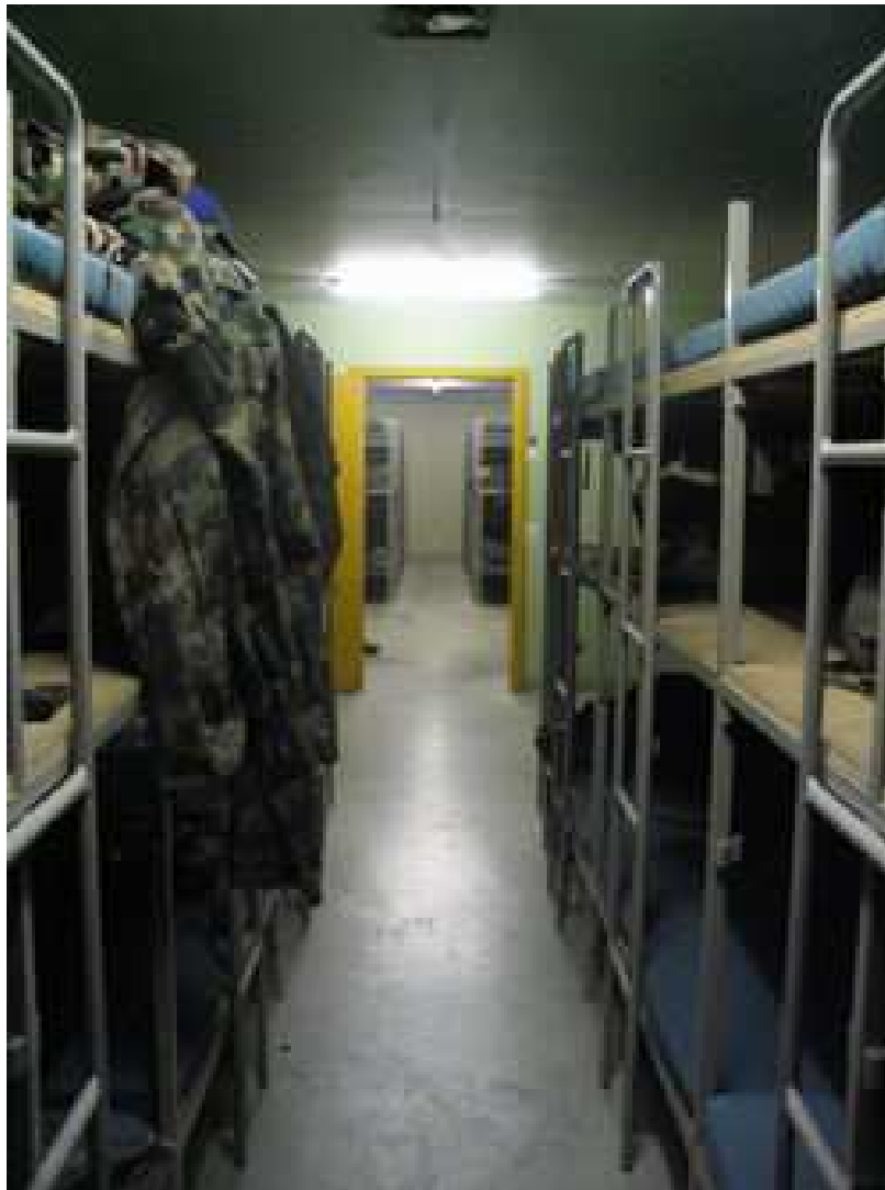
L'intérieur d'un abri antiatomique

Pour protéger les populations, les Etats entreprennent la construction d'abris souterrains mais il s'agit là de fortifications passives, dépourvues d'armement. L'objectif n'est plus d'arrêter l'adversaire, mais uniquement de préserver autant que possible la vie des combattants autant que des civils.